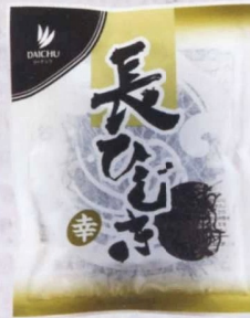
長ひじき 幸 20g

単品サイズ:145×240×40 単品重量:42g ボールサイズ:460×220×200 ボール重量:1.15kg 梱サイズ:460×440×400 梱重量:4.6kg