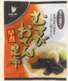
むすびおでん昆布 20g JANコード:4901925123224