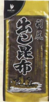
利尻出し昆布 50g JANコード:4901925186250