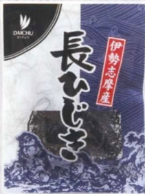
長ひじき 伊勢志摩産 10g