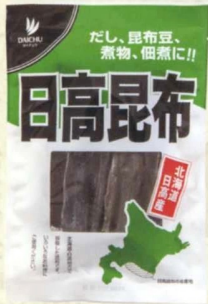
日高昆布 30g JANコード:4901925176244