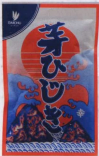
芽ひじき 幸 紙袋 23g JANコード:4901925202011