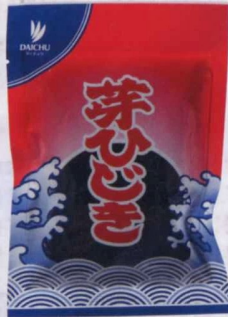
芽ひじき 45g JANコード:4901925203049