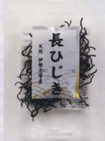
長ひじき 伊勢志摩産 14g

単品サイズ:130×170×25 単品重量:13g ボールサイズ:340×156×100 ボール重量:0.26kg 梱サイズ:340×312×400 梱重量:2.0kg