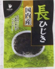
長ひじき 国内産 10g

単品サイズ:135×180×35 単品重量:17g ボールサイズ:340×156×110 ボール重量:0.31kg 梱サイズ:340×156×440 梱重量:1.2kg