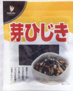
芽ひじき 50g JANコード:4901925203254