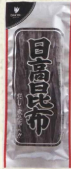
日高昆布 50g JANコード:4901925176251