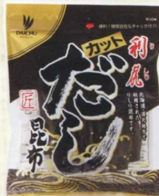
利尻カットだし昆布 匠 40g JANコード:4901925187240