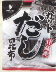
カットだし昆布日高産 30g JANコード:4901925178231