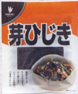
芽ひじき 40g JANコード:4901925203247