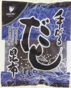
手がるだし昆布 45g JANコード:4901925184041