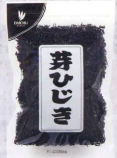
芽ひじき 100g JANコード:4901925203315